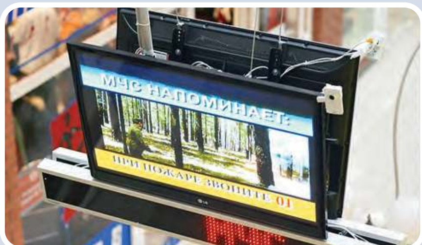
Пункт информирования и оповещения населения в зданиях с массовым пребыванием людей