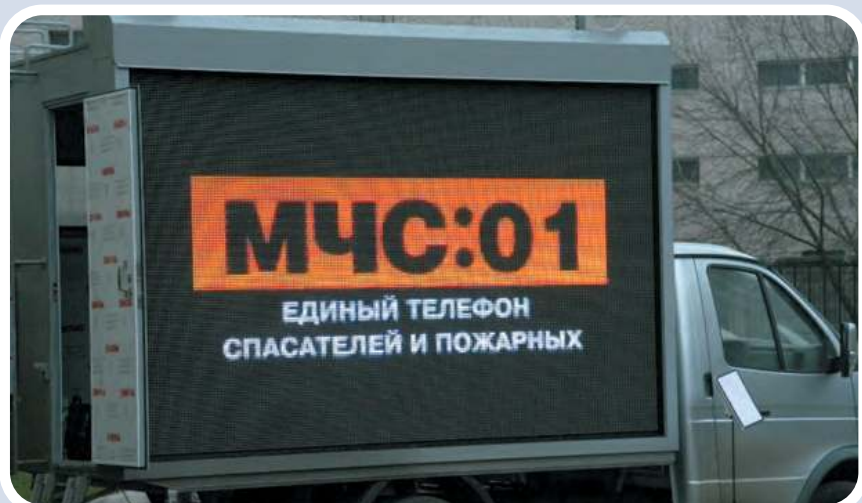
Мобильный комплекс информирования и оповещения населения