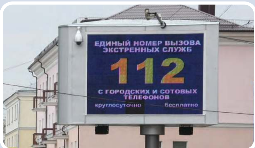
Пункт уличного информирования и оповещения населения